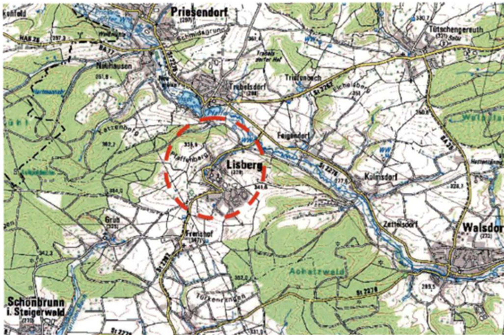
Abb. 1: Lage der Gemeinde Lisberg (Ausschnitt aus der TK M 1 : 25.000, Blatt 6130, Darstellung genordet, o. M.)

Lisberg liegt im Westen des Landkreises Bamberg, südlich der Gemeinden Priesendorf bzw. Trabelsdorf, nordöstlich der Gemeinde Schönbrunn im Steigerwald sowie nordwestlich der Gemeinde Walsdorf (s. Abb. 1).